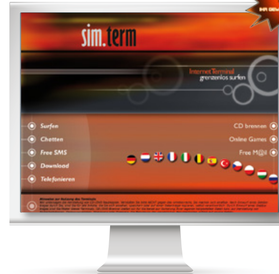
sim.term Aufsteller von Internet Terminals

Auftrag Konzeption und Gestaltung der Website, Corporate Design, Flyer, Präsentationen, gesamte Benutzeroberfläche für Internet Terminals Ziel Kundengewinnung hier abgebildet Startseite Benutzeroberfläche Internet Terminal