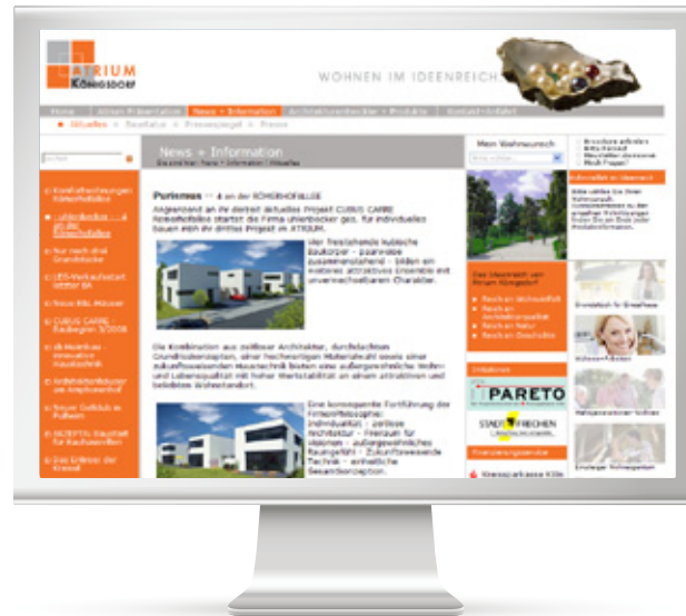
Atrium Königsdorf GmbH, Köln Neuartiges Eigenheimkonzept einer Bauträgeregemeinschaft Auftrag Konzeption und Gestaltung der Website (Archiv) Ziel Kundengewinnung